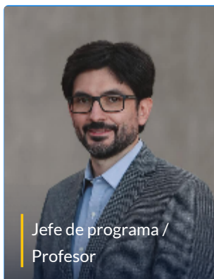
Jefe de programa / Profesor